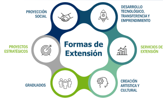
Ilustración 1. Dimensiones de Extensión de la Universidad de Santander