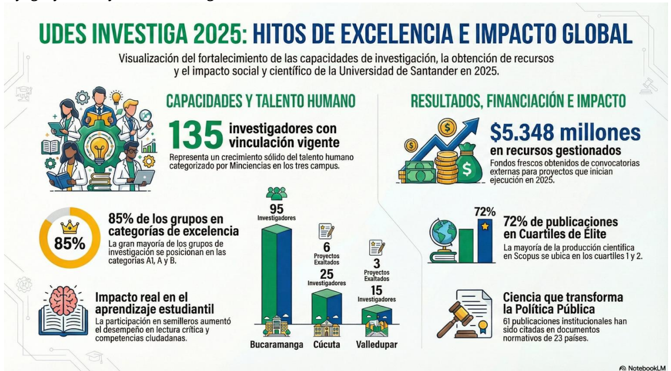
Figura 1. Infografía de cifras de Investigación UDES 2025