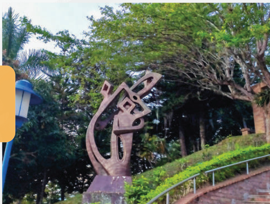
Escultor: Carlos Arturo Ortiz Báez Año: 2014.

Esta escultura, hecha en pedernal de piedra sintética, representa a tres estudiantes, plétóricos de sueños, emprendiendo su camino en búsqueda de su futuro.