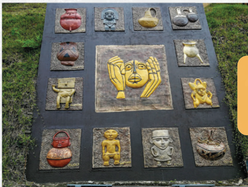
ESCULTURA: MURAL MUSEO ARQUEOLÓGICO Y ETNOLÓGICO UDES

Símbolo y síntesis de un sueño educativo concebido en familia. Esta escultura ya no sólo representa el sueño inicial de la familia fundadora, sino de todas las familias que llegan a este claustro a construir su propio sueño de la mano de la Universidad de Santander, UDES.