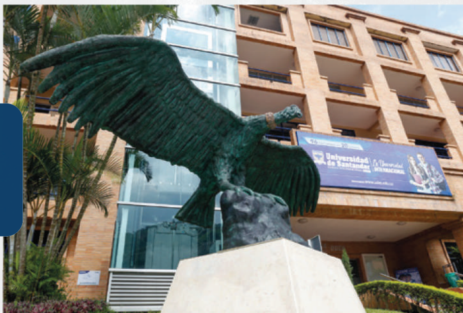
Escultor: Carlos Arturo Ortiz Báez.