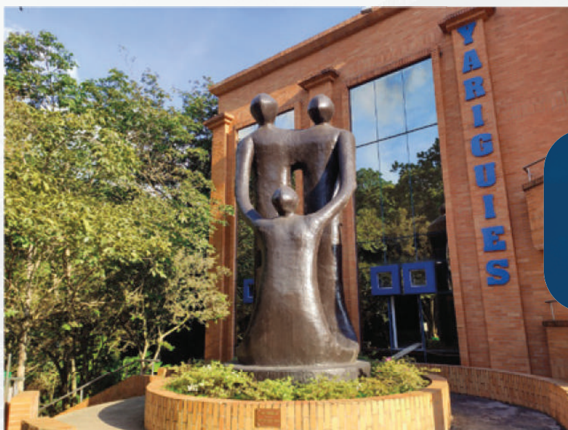
ESCULTURA: DE LA FAMILIA