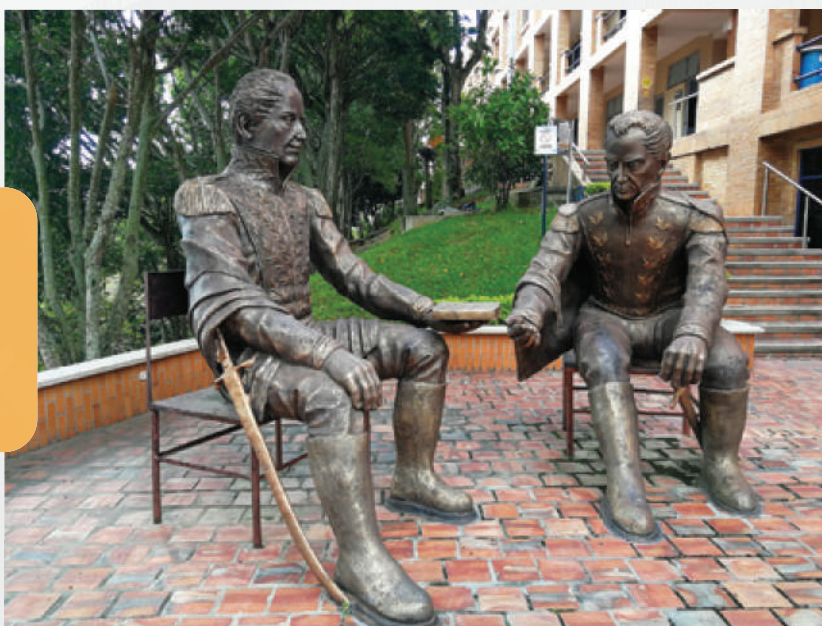
Escultor: Carlos Arturo Ortiz Báez.