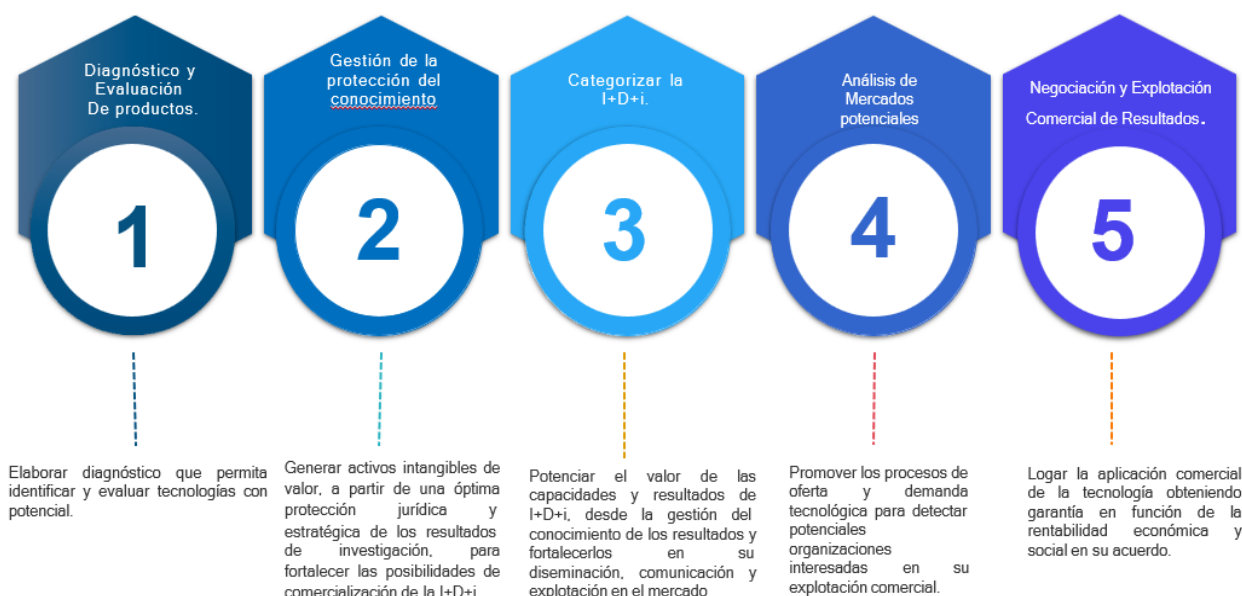
Figura 1. Ruta institucional para el desarrollo tecnológico (DESARROLLATEC)