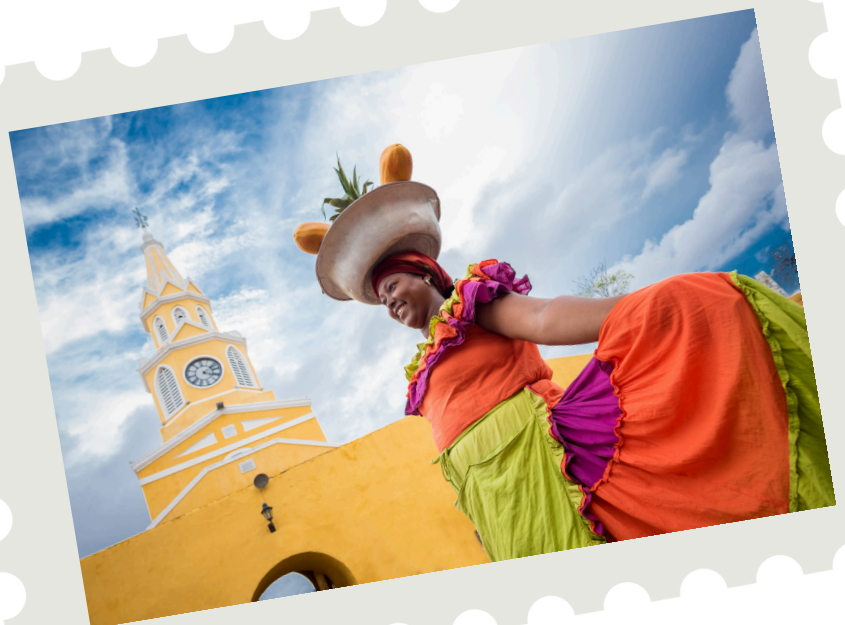
Foto: Cartagena, Colombia

En este sentido, la movilidad académica es considerada un eje transversal de la internacionalización, la cual permite el intercambio de saberes, el desarrollo de habilidades multiculturales y la transferencia de conocimientos , a su vez promueve la formación integral con proyección internacional.