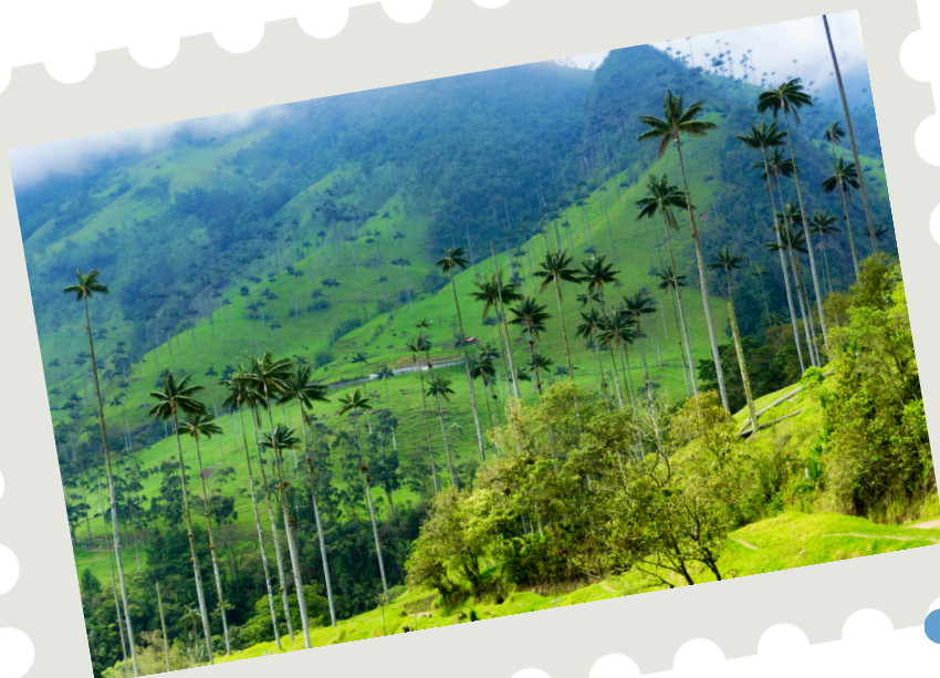
Foto: Quindío, Colombia

Promover la interacción entre estudiantes de la Universidad de Santander y los estudiantes visitantes nacionales y extranjeros a través del intercambio intercultural y la transferencia conocimientos y la generación de espacios de enseñanza – aprendizaje que contribuyan a la internacionalización del currículo.