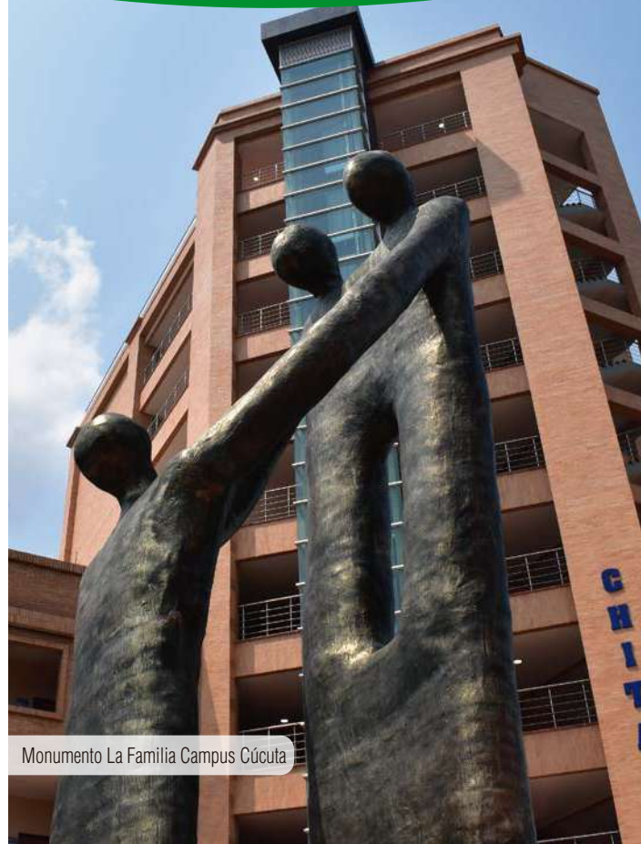
Monumento La Familia Campus Cúcuta