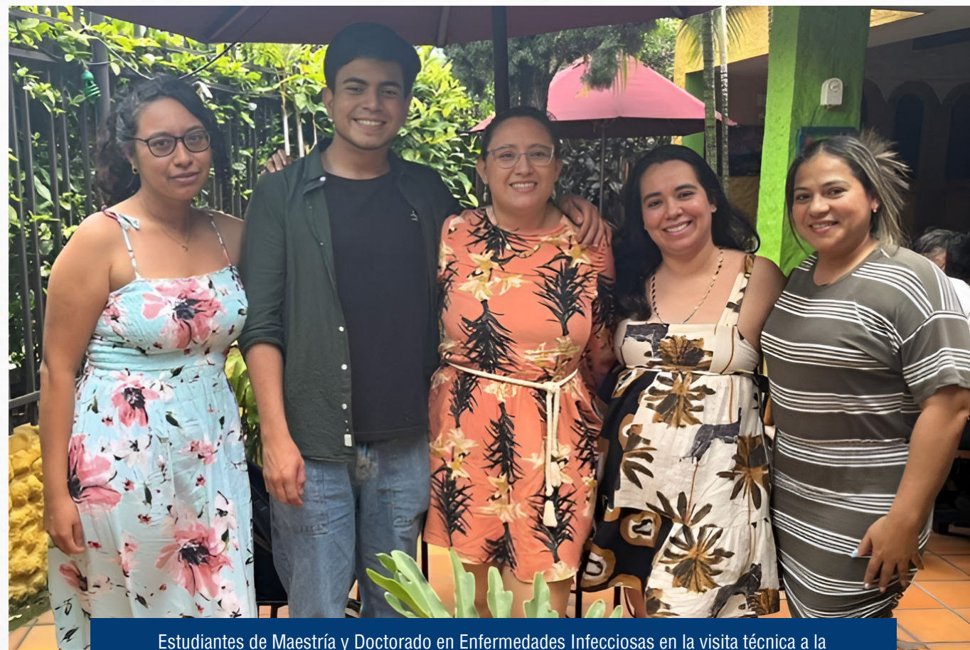
Estudiantes de Maestría y Doctorado en Enfermedades Infecciosas en la visita técnica a la Clínica San Luis, Bucaramanga – Colombia.