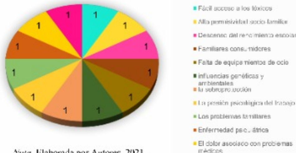
Nota. Elaborada por Autores, 2021.

En la Figura se evidencia que el consumo de sustancias psicoactivas (SPA) en el mundo es un problema de salud pública que tiene gran impacto en muchos ámbitos; los principales factores asociados al consumo de SPA son: influencia del grupo de pares, disponibilidad de sustancias en el entorno, presencia de síntomas depresivos, abandono escolar, consumo en la familia, uso de sustancias «gatillo» como el tabaco y el alcohol y factores psicológicos y biológicos individuales ocasionando en estos pacientes lesiones de causa externa, fracaso académico y laboral, relaciones sexuales no planificadas e inseguras y, en casos extremos, el suicidio.